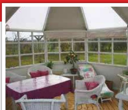
Interiørfoto 12,4 m 2