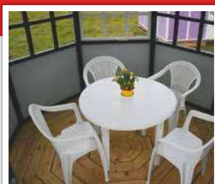
Interiørfoto 5,9 m 2

Hvor stor en model, man skal vælge afhænger naturligvis af, hvordan man påtænker at bruge pavillonen. Generelt bliver de gæster, der besøger vores udstillinger overraskede over, hvor rummelige pavillonerne er i virkeligheden. F.eks. er der rigelig plads til et bord til 4 personer i en pavillon på 5,9 m 2 , og modellen på 12,4 m 2 kan rumme helt op til 16 personer. Billederne nedenfor kan give et indtryk af de forskellige størrelser.