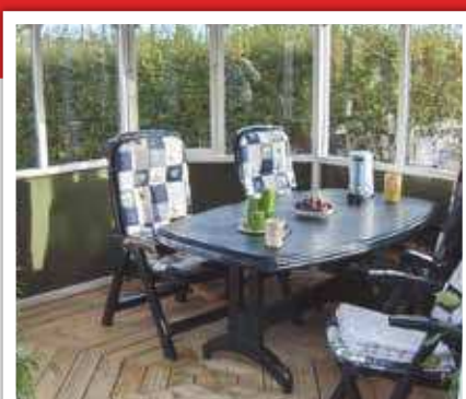
Interiørfoto 8,2 m 2